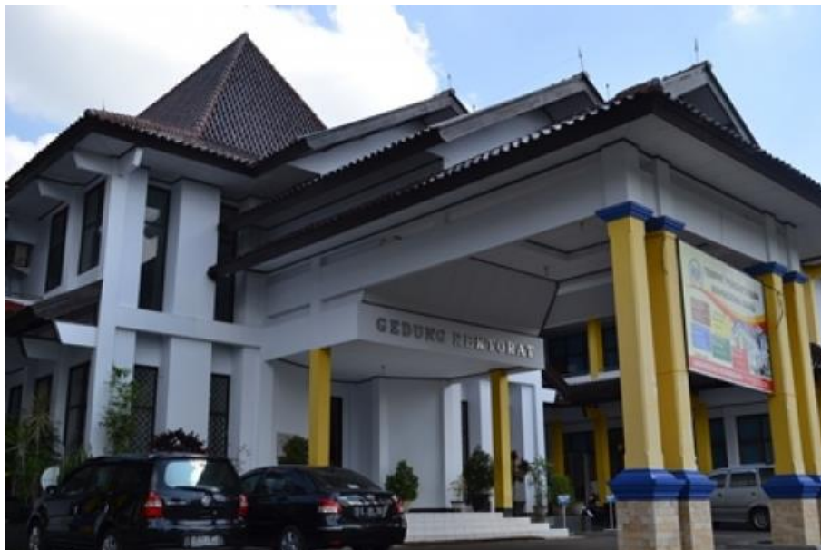
Gambar Gedung Rektorat Universitas Kuningan https://uniku.ac.id/images/foto_sejarah/1278uniku.JPG