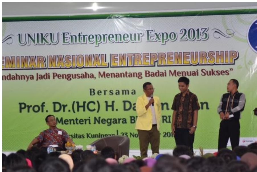
Gambar Seminar Entrepreneurships di Universitas Kuningan https://uniku.ac.id/images/foto_berita/507DSC_0481.JPG