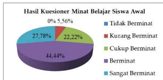
Gambar 1. Hasil Kuesioner Minat Belajar Siswa Awal

Kategori minat belajar siswa sebelum mengerjakan kuis daring melalui Kahoot! dan Quizizz ditunjukkan oleh Gambar 1. Gambar ini mendemonstrasikan bahwa minat belajar siswa sudah cukup baik.