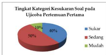
Gambar 3. Hasil Tingkat Kesukaran Soal pada Pertemuan Pertama

Dengan menggunakan hasil pengerjaan semua siswa di pertemuan pertama, tingkat kesukaran 50% soal yang disusun masuk ke dalam kategori sedang, sedangkan soal-soal lainnya masuk ke dalam kategori sukar dan mudah. Hasil ini secara lebih lengkap ditunjukkan oleh Gambar 3.