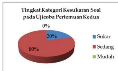
Gambar 4. Hasil Tingkat Kesukaran Soal pada Pertemuan Kedua

Hasil yang cukup menarik dijumpai pada tingkat kesukaran soal di pertemuan ketiga. Dari 10 soal yang diujikan ke siswa, tingkat kesukarannya masuk ke dalam kategori sedang, perhatikan Gambar 5.