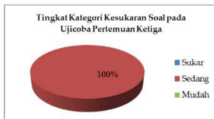
Gambar 5. Hasil Tingkat Kesukaran Soal pada Pertemuan Ketiga

Hasil yang cukup menarik dijumpai pada tingkat kesukaran soal di pertemuan ketiga. Dari 10 soal yang diujikan ke siswa, tingkat kesukarannya masuk ke dalam kategori sedang, perhatikan Gambar 5.