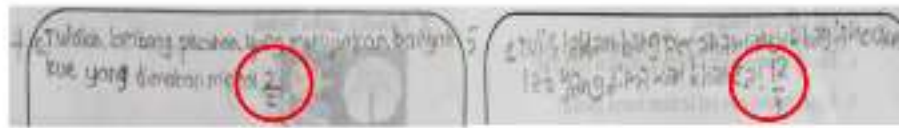
Gambar 3. Kesalahan Jawaban Ditinjau dari Langkah Menyusun Rencana

Dari Gambar 3 menunjukkan bahwa masih terdapat kekeliruan dalam membuat model matematika dalam bentuk lambang pecahan. Pada soal nomor 4 lambang pecahan yang disajikan siswa kurang tepat karena antara pembilang dan penyebut nilainya sama dan itu tidak sesuai dengan yang diketahui dalam soal. Pada soal nomor 5 lambang pecahan yang disajikan siswa terbalik antara nilai pembilang dan penyebut. Berdasarkan paparan tersebut menunjukkan siswa mengalami kesulitan dalam menyusun model matematika yang berkaitan dengan lambang pecahan. Padahal menyajikan lambang pecahan merupakan hal yang sangat penting karena lambang pecahan merupakan inti dari pecahan itu sendiri. Hasil tersebut berbanding terbalik dengan temuan sebelumnya yang menyebutkan bahwa mayoritas siswa sudah bisa menyajikan pecahan ke dalam bentuk gambar dan dari gambar menjadi lambang pecahan (Liestarie & Karlimah, 2017).