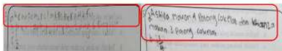
Gambar 2. Kesalahan Jawaban Ditinjau dari Langkah Memahami Masalah

Memahami masalah dalam matematika yaitu dapat mengidentifikasi dan menuliskan unsur yang diketahui dan ditanyakan serta dapat memeriksa kesesuaian unsur untuk menyelesaikan masalah. Menuliskan unsur yang diketahui dan ditanyakan merupakan hal yang kurang diperhatikan namun sangatlah penting karena untuk dapat menyelesaikan suatu soal matematika berawal dari apa yang diketahui dan ditanyakan dalam soal. Salah satu contoh kesalahan jawaban siswa berdasarkan langkah memahami masalah dapat dilihat pada Gambar 2.