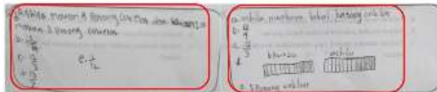
Gambar 5. Kesalahan Jawaban Ditinjau dari Langkah Memeriksa Kembali Kebertarian Solusi

Dari Gambar 5 menunjukkan bahwa tidak satupun yang mencantumkan langkah memeriksa kembali jawaban yang diperoleh. Pada jawaban nomor 5 sebelah kiri siswa memberikan jawaban akhir (poin e) bukan dalam bentuk lambang pecahan, padahal sudah jelas dalam soal diminta untuk memberikan jawaban dalam bentuk pecahan. Terlihat siswa tersebut tidak memeriksa kembali jawaban yang diperolehnya. Pada jawaban nomor 5 sebelah kanan siswa memberikan jawaban akhir (poin e) dalam bentuk pecahan namun jawaban tersebut salah, jika dilihat dari jawaban sebelumnya yang menuntun ke jawaban akhir tersebut semuanya salah bahkan unsur yang diketahui pun tidak lengkap dan tidak menuliskan unsur yang ditanyakan. Terlihat siswa tersebut tidak memeriksa kembali jawaban yang diperolehnya. Berdasarkan pemaparan tersebut menunjukkan siswa mengalami kesulitan menentukan langkah-langkah untuk memeriksa kembali jawaban yang diperolehnya.