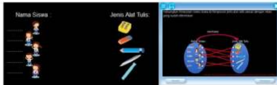
Gambar 2. Eksplorasi tahap ikonik

Kegiatan sebelum menggunakan media pembelajaran ini yaitu guru harus memberikan sebuah apersepsi yang nyata (tahap enaktif) bagi siswa agar selaras dengan yang terdapat pada media. Pada kegiatan ini guru mengajak siswa untuk belajar melalui berbuat atau melakukan suatu tindakan yang nantinya berkaitan dengan media pembelajaran. Melalui tahap enaktif ini dapat meningkatkan ketertarikan siswa untuk belajar karena siswa mengalami langsung hal yang dipelajari. Dalam penelitian yang dilakukan oleh Lovita (2017) juga dikatakan bahwa belajar melalui berbuat/tindakan langsung memiliki manfaat yang besar dalam berlangsungnya proses pembelajaran. Selain dapat memberikan gambaran yang nyata tentang suatu objek, tindakan nyata juga memungkinkan siswa untuk belajar secara mandiri dan ikut terlibat secara aktif dalam proses pembelajaran sehingga meningkatkan gairah dan motivasi belajar siswa dan pada akhirnya dapat meningkatkan hasil belajar (Ardana, 2016).