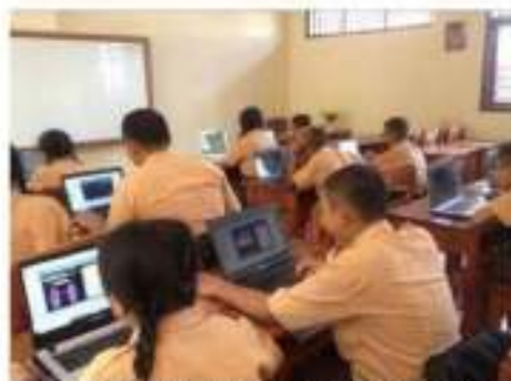
Gambar 1. Uji coba media pembelajaran

Berdasarkan hasil analisis angket respon siswa diperoleh bahwa rata-rata skor kepraktisan dari angket respons siswa adalah 45,94. Sehingga berdasarkan kriteria kepraktisan angket respon siswa, skor yang berada pada interval 37,40 < \bar{x} \leq 46,20 dapat dikatakan bahwa media pembelajaran yang dikembangkan ber kriteria baik dalam aspek kepraktisan. Dari hasil analisis angket respon guru diperoleh bahwa skor total kepraktisan dari angket respons guru adalah 50. Skor tersebut berada pada interval 40,80 < \bar{x} \leq 50,40 dengan kata lain bahwa media pembelajaran yang dikembangkan ber kriteria baik dalam aspek kepraktisan.