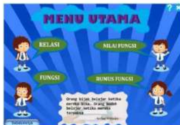
Gambar 4. Sisipan kalimat motivasi pada media

Karakteristik yang kedua yaitu media pembelajaran memuat konsepsi jengah untuk mendukung peningkatan pemahaman konsep matematika siswa. Media pembelajaran memuat konsepsi jengah untuk memotivasi siswa dalam belajar. Ardana, Ariawan & Divayana, (2018) mengatakan bahwa konsepsi jengah dalam konteks budaya memiliki konotasi semangat. Konsep inilah yang perlu ditumbuhkembangkan pada diri siswa sehingga segala sesuatu yang dipelajari relatif mudah untuk dipahami.