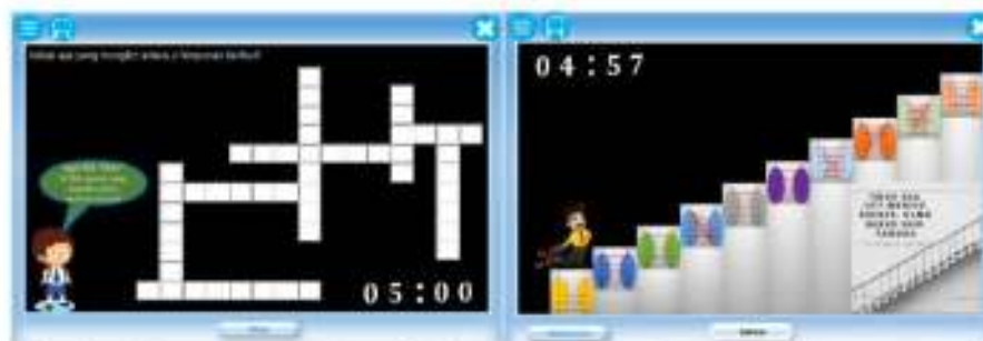
Gambar 5. Tantangan yang harus diselesaikan siswa untuk menumbuhkan rasa jengah.

Gambar 4 menunjukkan aplikasi pembelajaran membangkitkan 5 konsepsi jengah pada siswa melalui kalimat-kalimat sugestif yang dimunculkan pada aplikasi pembelajaran, “Rasa ingin tahu akan mengalahkan rasa takut, bahkan melebihi keberanian”, “Jangan pernah berhenti belajar, karena hidup tak pernah berhenti mengajarkan”, “Dengan bekal ilmu, seseorang bisa bertahan hidup”. 6 Konsepsi jengah ini akan mampu memotivasi siswa dalam belajar sebab konsepsi jengah dapat merupakan motor penggerak dari setiap kegiatan yang dikerjakan, dapat memberikan arah kegiatan, yakni ke arah tujuan yang hendak dicapai, dan mampu menentukan perbuatan-perbuatan apa yang harus dilakukan guna mencapai tujuan.