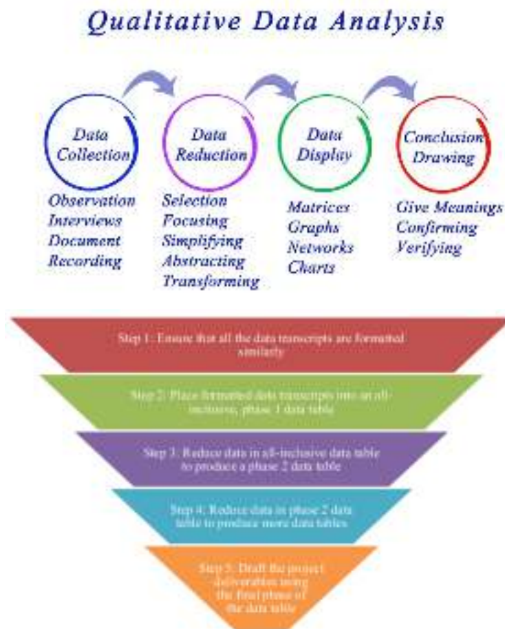
Gambar 1. Tahapan Analisis Data Kualitatif

Teknik analisis data kualitatif dalam kajian ini menggunakan tahapan sebagai berikut.