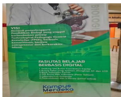
Data 3 banner prodi Biologi

dan e-library . Kesalahan ini disebabkan karena kurangnya pengetahuan terkait penulisan sesuai kaidah kebahasaan.