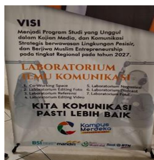
Data 8. Ilmu Komunikasi

Pada data 8 (Ilmu Komunikasi) ditemukan tiga kesalahan berbahasa yaitu Co-Working Space , Editing dan Podcast . Ketiga kesalahan ini memiliki kasus yang sama yakni kesalahan penulisan istilah asing yang seharusnya dicetak miring, perbaikan yang tepat untuk kedua kesalahan tersebut ialah Co-Working Space , Editing dan Podcast . Kesalahan ini disebabkan karena kurangnya pengetahuan terkait penulisan sesuai kaidah kebahasaan.