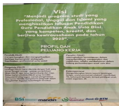
Data 2, banner prodi PG-PAUD

Pada data 2, ditemukan 3 kesalahan berbahasa yakni mengembangkan , meningkatkan , dan event organizer . Pada kata mengembangkan dan meningkatkan terdapat kesalahan berbahasa yakni tidak menggunakan huruf kapital pada awal kalimat, ini disebabkan karena kurangnya pemahaman serta kurangnya ketelitian dalam penulisan. Perbaiki kata yang benar yakni Mengembangkan dan Meningkatkan karena berada pada awal kalimat. Kesalahan selanjutnya yakni event organizer yang merupakan kesalahan penulisan istilah asing. Penulisan yang tepat untuk istilah asing ialah dengan cetak miring yakni event organizer . Kesalahan ini bisa disebabkan karena kurangnya pengetahuan tentang kaidah penulisan yang baik dan benar menurut EYD.