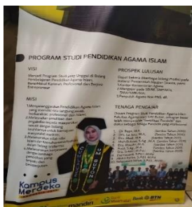
Data 5. Banner Prodi Pendidikan Agama Islam

tanggung jawab dan diberbagai seharusnya juga kata di dipisah dengan kata berbagai seharusnya di berbagai . Kesalahan yang kedua pada penulisan kata melasnakan seharusnya melaksanakan kemudian kata pegabdian seharusnya pengabdian dan kata berkera seharusnya berkerja . Penyebab kedua kesalahan penulisan diatas disebabkan dua hal yaitu, pertama kurangnya pemahaman penggunaan EYD, yang kedua kurangnya ketelitian dalam pengetikan sehingga terjadinya kesalahan penulisan.