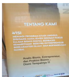
Data 6. Banner prodi Manajemen

Pada data 6, terdapat dua kesalahan penulisan pada kasus yang sama yaitu, penulisan kata dibidang dan disini . Seharusnya penggunaan kata di pada kesalahan yang ditemukan harus dipisah seperti di bidang dan di sini . disebabkan oleh kurangnya pemahaman penggunaan EYD.