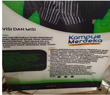
Data 1. Banner penerimaan mahasiswa baru Prodi PGSD

Pada data 2, ditemukan 3 kesalahan berbahasa yakni mengembangkan , meningkatkan , dan event organizer . Pada kata mengembangkan dan meningkatkan terdapat kesalahan berbahasa yakni tidak menggunakan huruf kapital pada awal kalimat, ini disebabkan karena kurangnya pemahaman serta kurangnya ketelitian dalam penulisan. Perbaiki kata yang benar yakni Mengembangkan dan Meningkatkan karena berada pada awal kalimat. Kesalahan selanjutnya yakni event organizer yang merupakan kesalahan penulisan istilah asing. Penulisan yang tepat untuk istilah asing ialah dengan cetak miring yakni event organizer . Kesalahan ini bisa disebabkan karena kurangnya pengetahuan tentang kaidah penulisan yang baik dan benar menurut EYD.